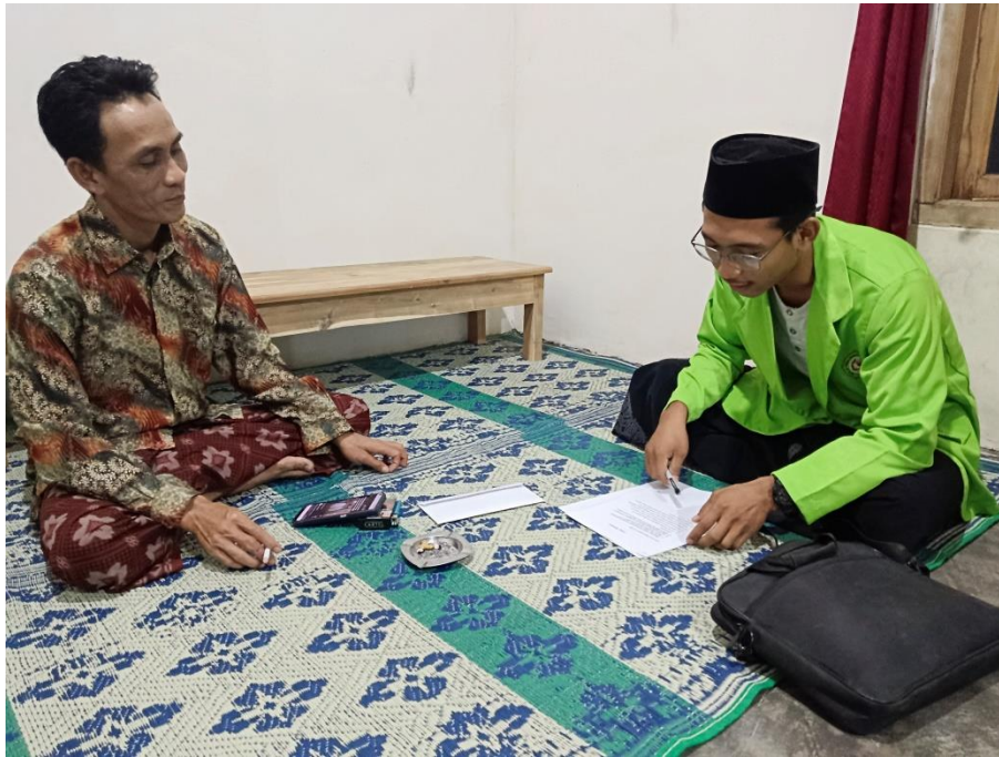
Dokumentasi : Wawancara dengan Pengurus Sekaligus Kepala Pesantren