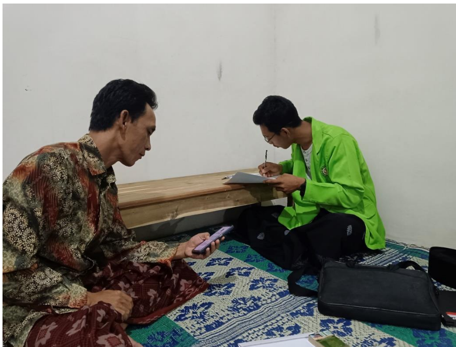
Dokumentasi : Wawancara dengan Pengurus Sekaligus Kepala Pesantren