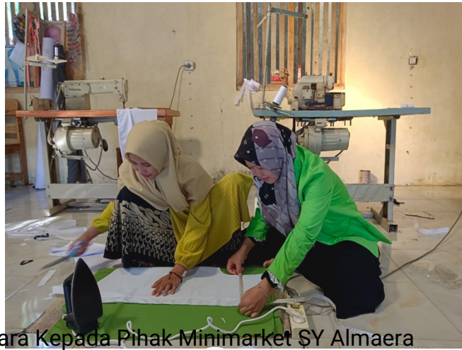
Lampiran 2. Wawancara Kepada Pihak Minimarket SY Almaera