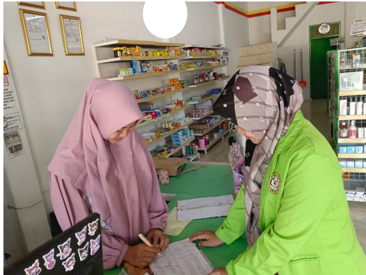
Lampiran 3. Wawancara dan Observasi di Koperasi Pondok